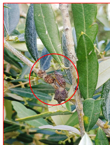
Adulti di cimice asiatica