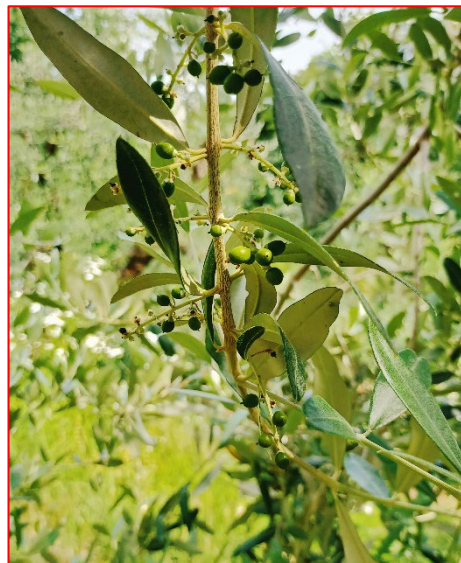
Fase fenologica attuale- Valtinesi