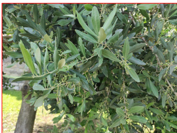
Fase fenologica rilevata - areale sebino