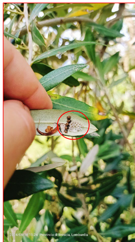
Ovatura di cimice asiatica con neanidi di I Età- Alto Garda