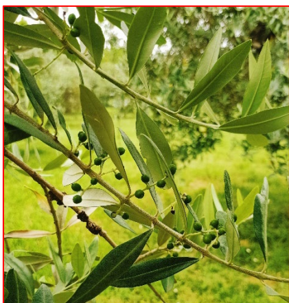
Fase fenologica attuale-Alto Garda