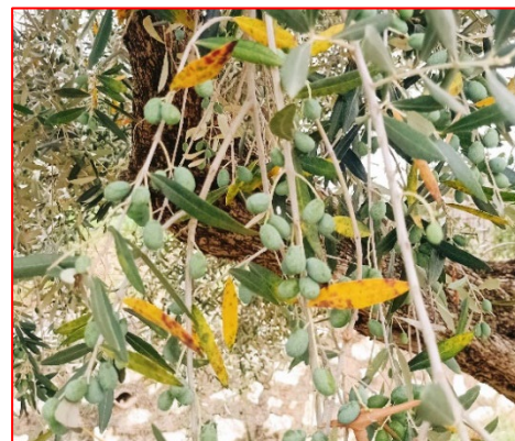
Fase fenologica -areale Garda

In tutto l'areale si consiglia di monitorare la presenza delle rosure di margaronia e d'intervenire con un prodotto a base di Bacillus thuringiensis da eseguire nelle ore più fresche, ricordandosi di acidificare l'acqua se troppo dura, si ricorda che il trattamento va ripetuto a distanza di una settimana dieci giorni. Nel caso di forte attacco con rosure su drupa e larve di IV età alcune molecole usate per altri fitofagi (Acetamiprid e Deltametrina) hanno un effetto collaterale abbattente anche su margaronia . Nel caso di eventi grandinigeni si consiglia agli olivicoltori i cui oliveti siano colpiti di procedere a trattare con prodotti rameici, fosfonato di potassio o prodotti a base di bacillus subtilis e per contenere le infezioni di rogna dell'olivo soprattutto nel caso di varietà molto sensibili come Casaliva.