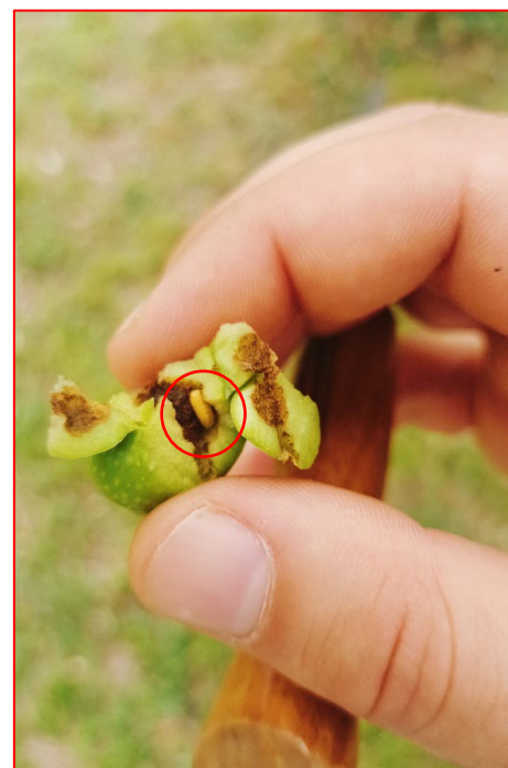
Pupa di mosca dell'olivo su varietà da mensa- areale Garda