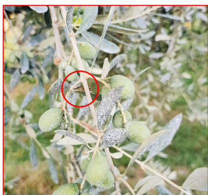
Ninfa di V età nascosta sotto le foglie- areale Garda