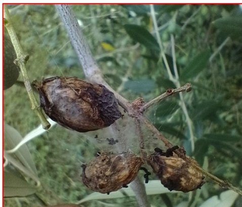
Olive attaccate da margaronia -areale Lario