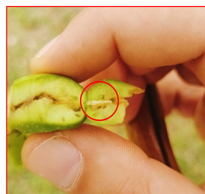
Larva di terza età di mosca dell'olivo, su varietà da mensa-areale Garda