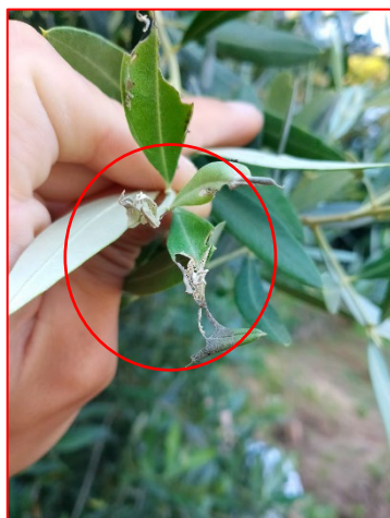
Rosure causate dall'attività trofica di margaronia