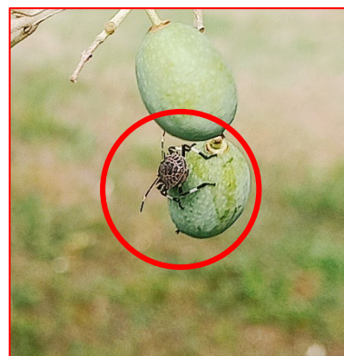
Ninfa di quarta età di cimice asiatica su drupa-areale